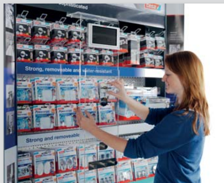
BRONZE für den tesa Shelf Frame in der Kategorie „Home & Garden“

Bei den aktuellen POPAI France 2013 Awards in Paris gewann DEINZER je einen GOLD, SILBER und BRONZE Award: