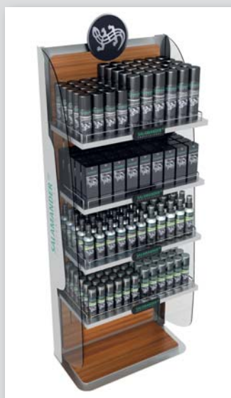
BRONZE für das Salamander Schuhpflege-Display in der Kategorie „Mode und persönliche Accessoires“

Bei den POPAI D-A-CH 2013 Awards in Düsseldorf wurde Deinzer mit folgenden Preisen ausgezeichnet: