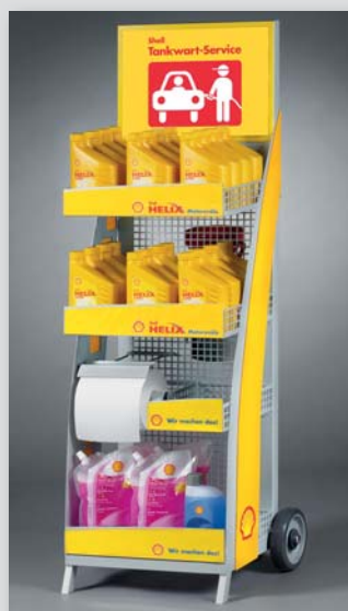
GOLD für den Shell Tankwart-trolley in der Kategorie „Reisen, Freizeit und Automobil“