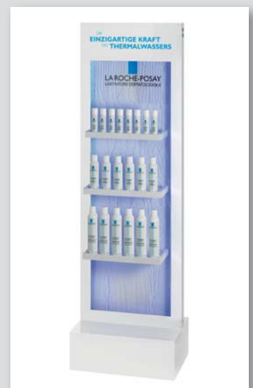
GOLD für das Bodendisplay „Thermalwasser“ für L’Oréal in der Kategorie „Pharmazeutische Produkte/Floor Stocker“