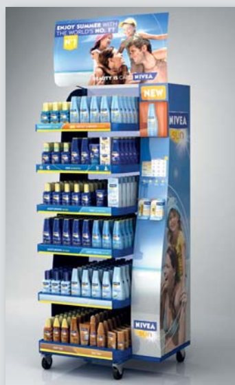
SILBER für das NIVEA SUN DISPLAY für Beiersdorf in der Kategorie „Körperpflege/ Hyper and Super Markets“